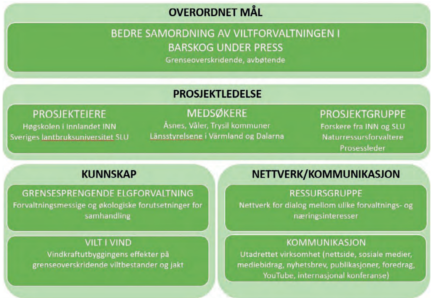
FIGUR 1. Strukturen til prosjektet GRENSEVILT 2. De ulike delene skal sammen bidra til å nå prosjektets overordnede mål.

de eksisterende elgforvaltningsområdene. Enda en kilde til dødelighet for elg er veier med stor trafikk, og denne risikoen fordeler seg også ulikt i landskapet. I tillegg til disse økologiske komponentene er det også kulturelle og næringsmessige ulikheter mellom rettighetshavere, med ulike verdier og målsetninger for egen eiendomsutvikling.